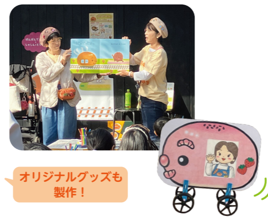
オリジナルグッズも製作!