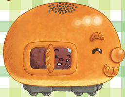
あんぱんぱんでんしゃ