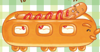
ホットドッグぱんぱんでんしゃ