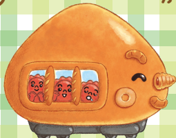
ジャムぱんぱんでんしゃ