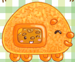
カレーぱんぱんでんしゃ