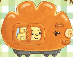
クリームぱんぱんでんしゃ