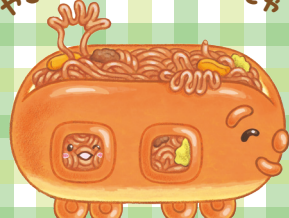
やきそばぱんぱんでんしゃ